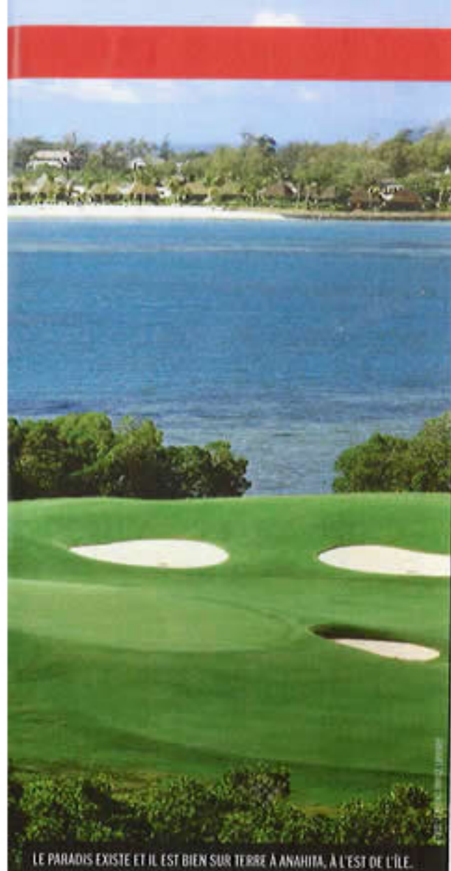
LE PARADIS EXISTE ET IL EST BIEN SUR TERRE À ANAHITA, À L'EST DE L'ÎLE.

En dehors de l'Anahita Club, il existe six autres 18 trous à l'île Maurice, qui en font une destination golfique très prisée. > Le Paradis, au pied du Morne à la pointe sud-ouest de l'île, est le plus spectaculaire de tous, puisque le seul à être majoritairement bâti en bord de mer. > Le parcours de l'île aux Cerfs, sur la côte est, est un véritable jardin exotique coupé du monde. > Le Legend et le Links, les deux golfs historiques de l'île, reliés aux hôtels Belle-Mare et Prince Maurice sur la côte nord-est. > Le Tamarina, dernier-né de la bande, une sorte de réserve africaine plantée à l'ouest. > Le golf de Bel-Ombre, non loin du Morne, sans doute le plus équilibré et le plus accessible de tous.